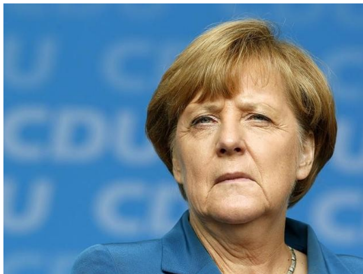
Abbildung 2: Bundeskanzlerin Angela Merkel